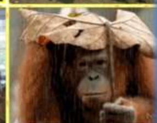
Вот и ЛЕТО прошло словно и не бывало